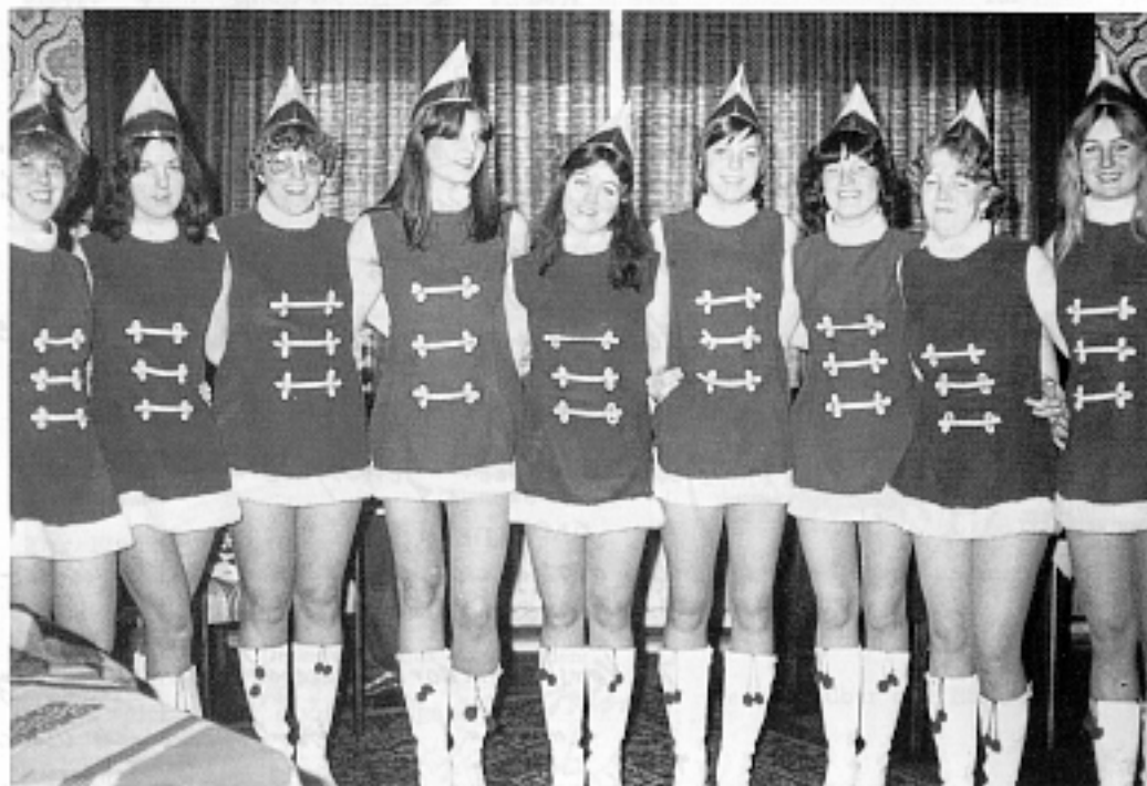
...GSC – Tanzgarde aus den 70- er Jahren