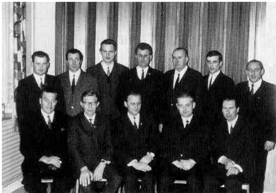
Vorstand des Gettorfer SC im Jahre 1968

Der Aufstellung ist zu entnehmen, dass nach der Gründungsphase diese Vorstandsämter für lange Zeiträume von denselben Personen besetzt wurden. Diese Umstände waren u. a. Grundlage mit für die erfolgreiche Arbeit der verschiedenen geschäftsführenden Vorstände.